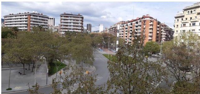
Imatge captada des del carrer Josep Tarradellas-Berlin