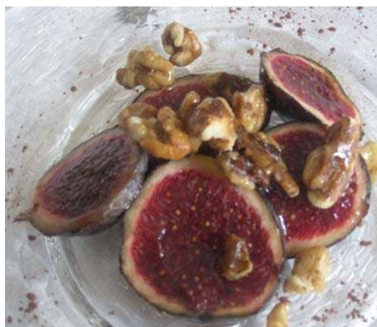
Figues amb nous